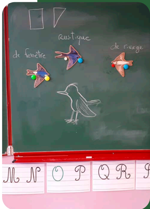
Représentations initiales pour définir l'oiseau et le comparer avec les hirondelles (STÉPHANE TROUBAT)