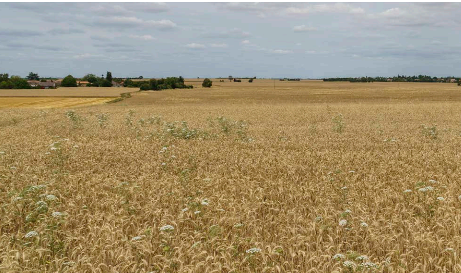
Champ de blé ayant accueilli dix nids de busards (GUILLAUME GRÈGE)