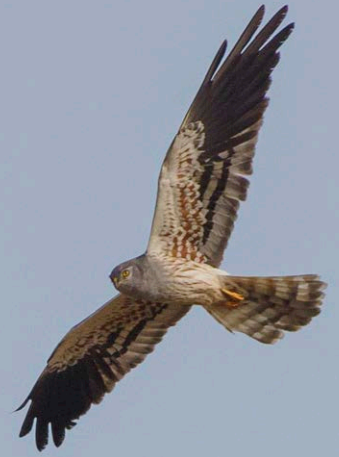
▲ Busard cendré mâle (GUILLAUME GRÈGE)

Le busard cendré est un rapace migrateur qui vit en Afrique et revient chez nous chaque année en avril pour nicher, dans les cultures le plus souvent. Or, la majorité des poussins ne savent pas encore voler au moment des moissons et risquent d'être involontairement détruits. Les bénévoles de la LPO s'attachent donc à localiser les nids et, en collaboration avec les agriculteurs, les protègent en les entourant d'un grillage que les moissonneuses contourneront. Une fois la moisson faite, les parents continuent à nourrir les jeunes jusqu'à leur envol. Cette action de protection est indispensable à la sauvegarde de ce grand consommateur de campagnols !