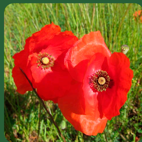
Coquelicot (CYRILLE POIREL)